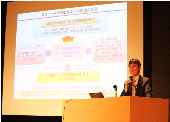
講演 内閣官房 情報通信技術 (IT) 総合戦略室 企画官 縄田 俊之氏