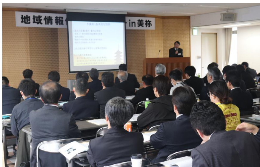
【セミナー会場前方】