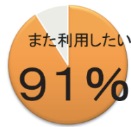
初回利用者向けアンケート