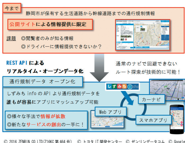
図-3 取組みの全体概要