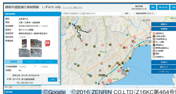
図-2 道路通行規制情報の一般公開サイト

しずみちinfoでは、大規模災害時のアクセス集中による高負荷の運用を想定したクラウド環境で、道路の通行規制情報と災害情報(以下、「道路情報」という。)を公開サイトより一般公開しています。しかしながら、公開サイトでの情報提供には大きな課題がありました。それは、公開サイトにアクセスする閲覧者にしか詳細情報が伝わらないため、情報の拡散に限界があることです。アンダーパスの冠水、山間地の道路崩落などの情報は、人命にも関わる重要な情報ですので、運転中のドライバー、車で移動を考えている方等、多くの人にリアルタイムで提供したい情報です。こうした重要な情報を広く伝える手法について、庁内で検討を重ねた結果、Webアプリケーションやスマホアプリケーション(以下、「Webアプリ」という。)、またはカーナビ等に直接、道路情報のデータを発信できないか考えるようになりました。その解決策の一つが、道路情報のリアルタイム・オープンデータ化でした。道路情報をライセンス契約などで縛られることなく、複製や再配布はもちろん、営利目的にも自由に利用できるオープンデータとして提供することが有効な手段であると考えました。