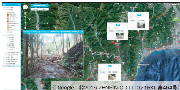
図-1 2014年台風18号での運用状況

しずみちinfoは、Googleのクラウド環境にて構築しており、静岡市内の道路における通行規制情報や災害情報を管理・発信しています。通常時は工事などの、災害時や異常気象時には道路災害などの通行規制情報を管理し、最新の道路情報として防災関係各部署で共有すると共に、市民へわかりやすく情報発信するためのGISです。400mmを超える雨量を観測し地域に多くの被害をもたらした2014年10月の台風18号の際も、災害情報の収集、整理や災害に伴う規制情報の発信などに効果を発揮しました。