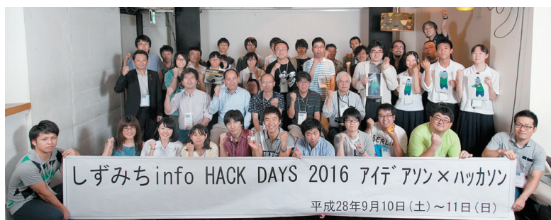
図－5 2016年開催ハッカソン

静岡市が行っているAPI利用促進に向けた取り組みを紹介します。そのひとつが、市内の企業や一般市民向けに実施した「API説明会」です。説明会には地元でアプリ開発をする多くの方に参加頂き、熱意を直に感じることができました。こうした取り組みを機に地元から新しいサービスが生まれ、地域の活性化につながることを期待せずにはいませんでした。また、APIから提供される「道路情報」と、「クルマ情報」の活用をテーマに実際にアプリを作成するイベント「ハッカソン」を2年連続で主催しています。この「ハッカソン」では、IT企業関係者や学生等から参加をいただき、行政だけでは発想できない新しいアイデアが多数発案されています。また、地元高校生と地元企業との貴重な交流の場にもなり、「ハッカソン」をきっかけとして「職場体験」する事例も生まれています。