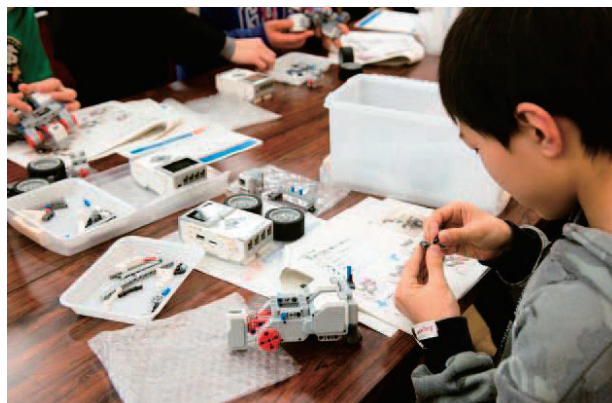
1人1体のロボットを組み立てる