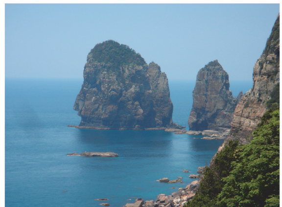
自然豊かな甌島のナポレオン岩