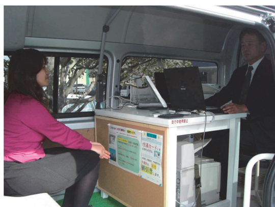
■車内では、職員が専用端末とプリンタを使って証明書を発行