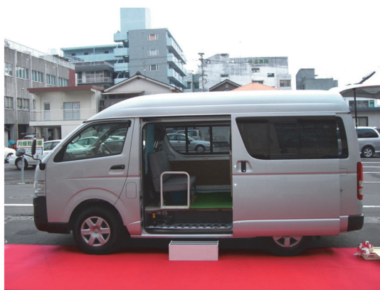
■下駄地域で導入した巡回移動連絡車の外観