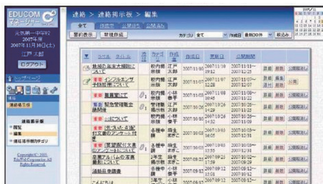
連絡掲示板 イメージ図