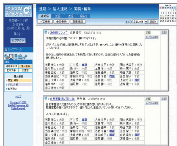
個人連絡イメージ図