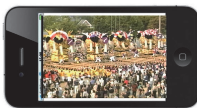
IP配信イベント中継