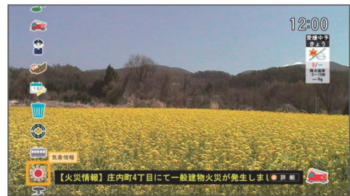
データ放送画面例

データ放送のコンテンツは、新居浜市役所のホームページや緊急メールと連動しており、ホームページ内容の更新や緊急メールが配信されれば、データ放送のコンテンツも自動で更新されるしくみとなっているため、情報の入力や管理が一元化されている。また、データ放送のアイコンをアプリ型デザインにしたのは、当初からスマートフォン向けに情報配信することを見据えたもので、ケーブルテレビの加入者のみならず、多くの市民が行政情報等を容易にリアルタイムで取得できることを目的としている。