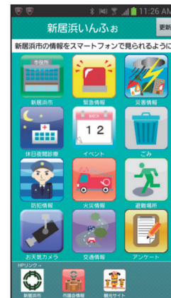
スマートフォン画面