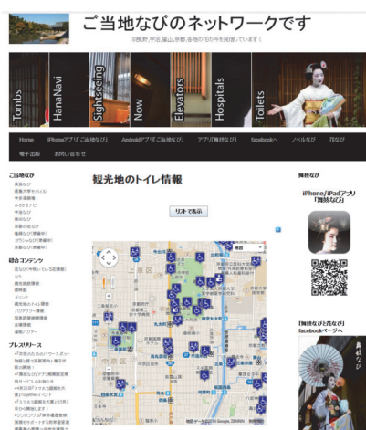
観光地のトイレ情報( http://i2navi.net/toilets )