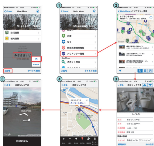
みささぎナビのトイレ情報(iOSアプリの場合)

※1. 「iOSアプリ」と「Androidアプリ」は、「ご当地なび」をダウンロードしてください。