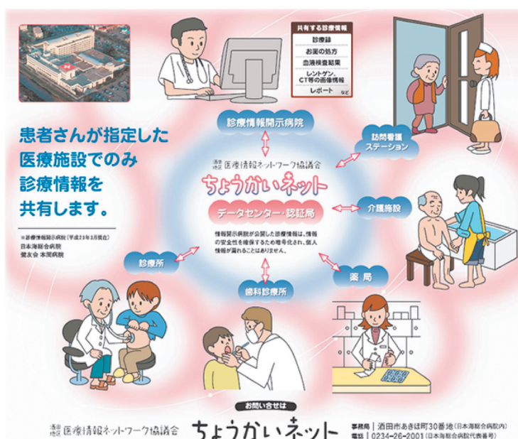
図3 ちょうかいネットイメージ図

に対応し、新Net4Uがサービスされました。今後は、システムの安定稼働を目指し、クラウド化も検討中です。