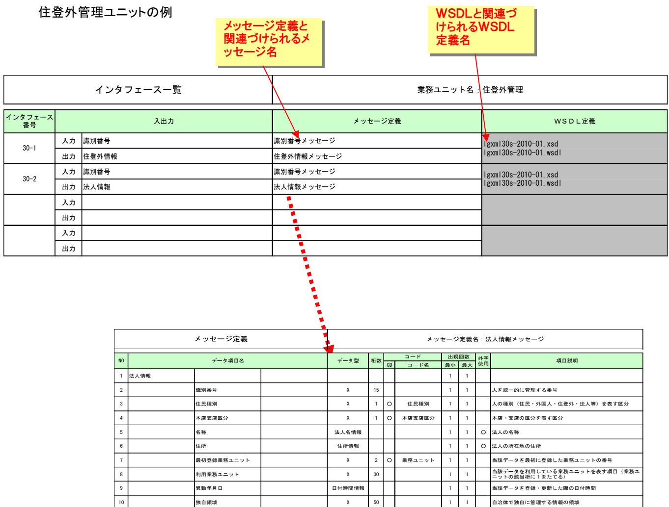
図6 インタフェース一覧