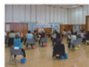
図5 事業取組効果の事例