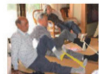
セラバンド体操（筋力向上）

運動サポーターが、地域で高齢者の集い等を実施している会場に、出向き、参加者の皆さんと転倒を予防するための運動を行っています。現在市内124ヶ所、3,240人が実践中！（H25.3月末）