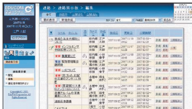
連絡掲示板 イメージ図