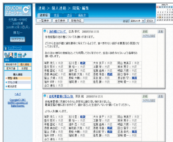
個人連絡イメージ図