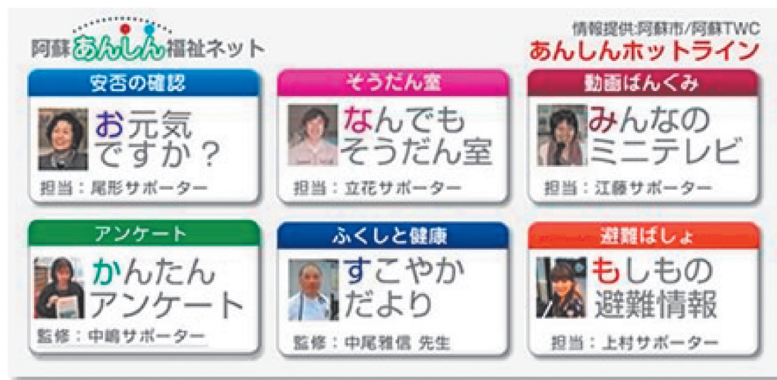
図2. 阿蘇あんしん福祉ネット画面