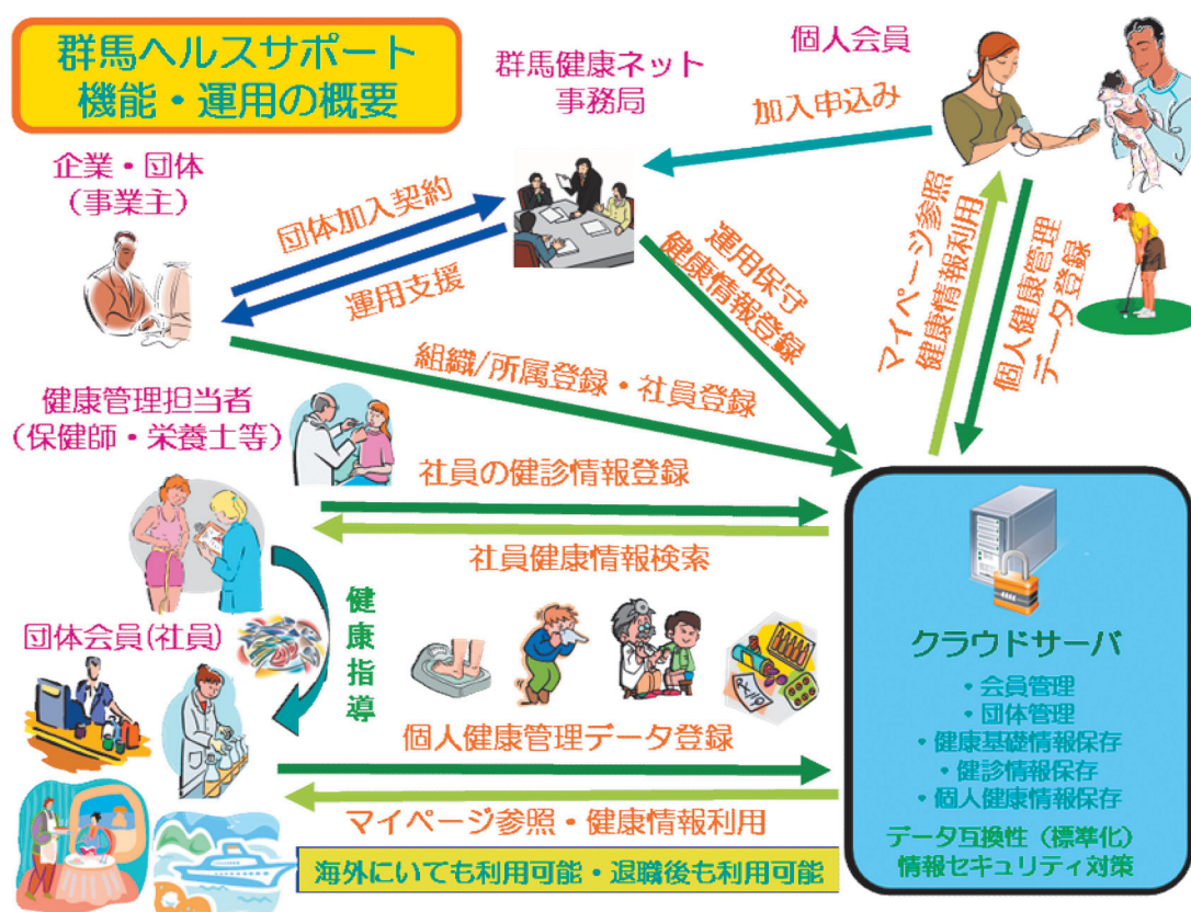
図1 群馬ヘルスサポートの機能・運用概要