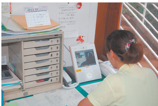
にっこりコールの健康相談の様子