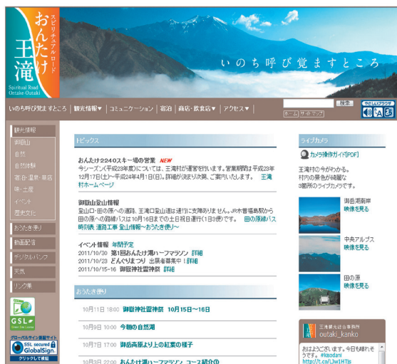
観光ポータルサイトの構築